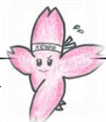
三宅柳田小マスコットキャラクター「みやなちゃん」