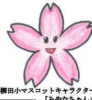
三宅柳田小マスコットキャラクター「みやなちゃん」