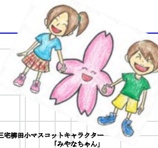
三宅柳田小マスコットキャラクター「みやなちゃん」