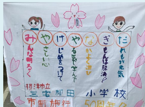
児童会作成フラッグ