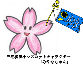
三宅柳田小マスケットキャラクター「みやなちゃん」