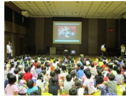
「二度と戦争が無いように」

4日の平和登校日には、暑い中ほとんどの子が元気な顔を見せてくれました。多目的ホールで、校長先生の話の後、低学年は「マヤの一生」、高学年は「世界がもし100人の村だったら」のビデオを観て平和について学習しました。 最後にみんなで『おりづる』の歌を合唱しました。