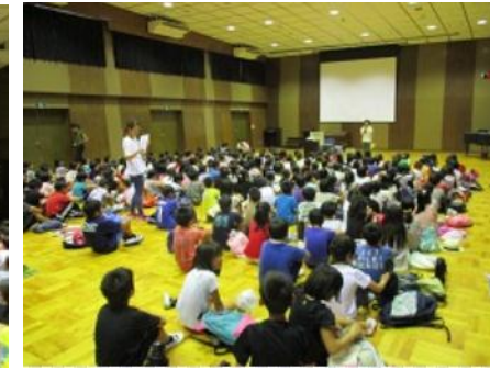
元気にしていましたか？