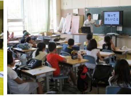
教室でも学習しました